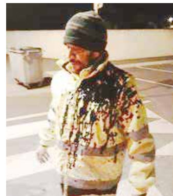
UN AGENT COUVERT D'HUILE DE VIDANGE PENDANT UNE COLLECTE

Un geste qui semble anodin peut avoir un impact sur votre environnement et sur nos agents.