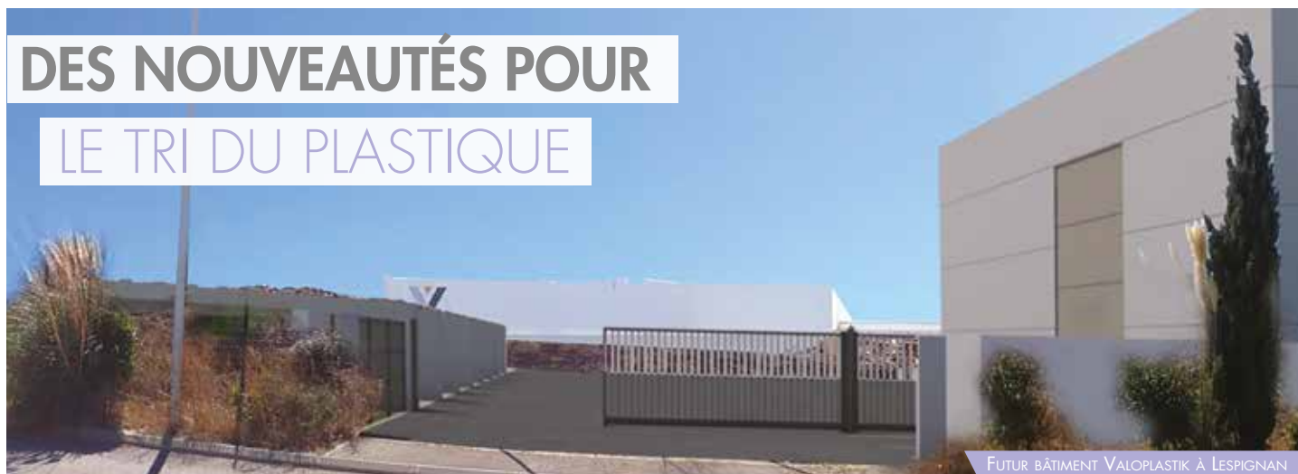
FUTUR BÂTIMENT VALOPLASTIK A LESPIGNAN