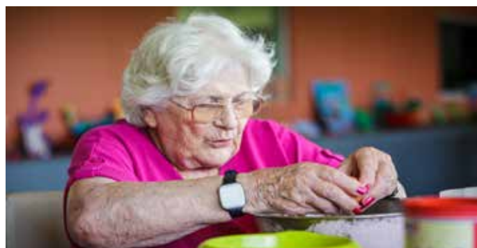
ATELIER CUISINE AVEC PRÉPARATION DE PÂTE À CRÊPES POUR TOUS LES RÉSIDENTS !