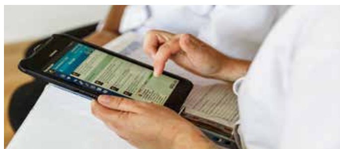
L'ÉQUIPE SOIGNANTE REÇOIT LES ALERTES EN TEMPS RÉEL SUR LEUR TABLETTE