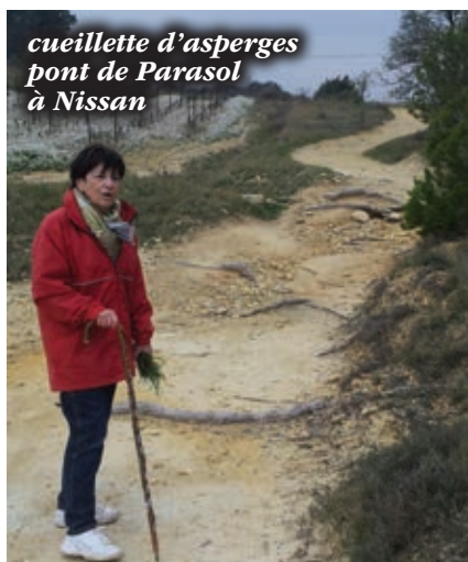
cueillette d'asperges pont de Parasol à Nissan

Ceci dit, les choses ont bien changé, depuis sa nomination de