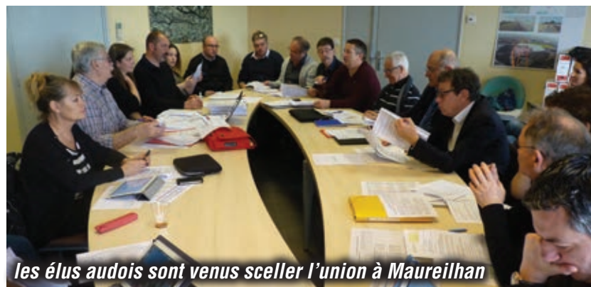
les élus audois sont venus sceller l'union à Maureilhan

L'association va donc porter les projets du territoire et les soumettre à la Région , autorité de gestion des fonds européens,