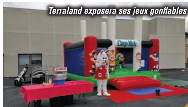
Terraland exposera ses jeux gonflables

Pulsion Diffusion se développe sur 12 500 m 2 pour le recyclage et la revalorisation industriels de modulaire acier. 25 à 30 emplois pourraient être créés.