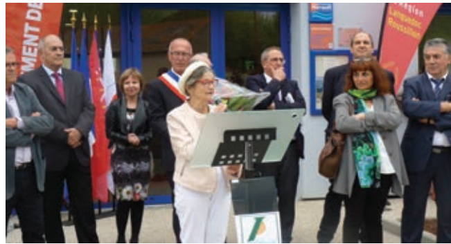
▲ La salle multiculturelle baptisée Marie Rouanet