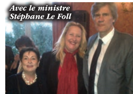
Avec le ministre Stéphane Le Foll