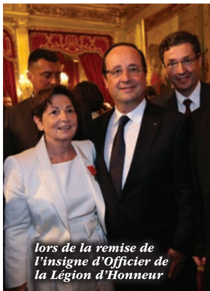
lors de la remise de l'insigne d'Officier de la Légion d'Honneur

“ Déjà, dans la poussette, je tenais colloque ! ”