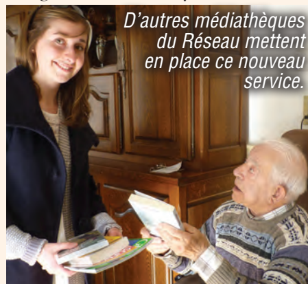
D'autres médiathèques du Réseau mettent en place ce nouveau service.

Dès le mois de mai , chaque 3 ème vendredi après-midi, une bibliothécaire livrera au domicile de la personne préalablement inscrite, une sélection d'ouvrages mais aussi de CD, DVD etc... en fonction de ses goûts et de son rythme de lecture.