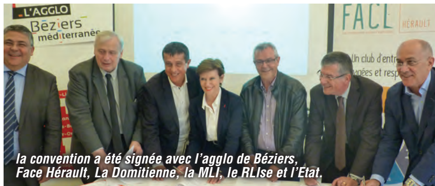
la convention a été signée avec l'agglo de Béziers, Face Hérault, La Domitienne, la MLI, le RLise et l'État.

Dernière signature en date, le 31 mars avec la fondation Face Hérault , pour la mise en place d'une plateforme mobilité, qui va aider les personnes en insertion professionnelle à se déplacer. La Mission Locale d'Insertion et le Réseau Local d'Initiatives, seront les relais.