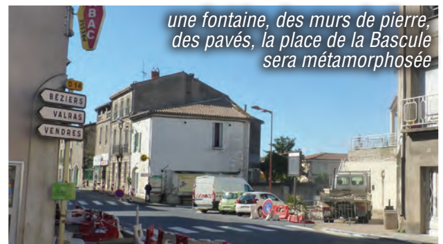
une fontaine, des murs de pierre, des pavés, la place de la Bascule sera métamorphosée

La place d'antan revisitée, les espaces publics repensés, le cœur de la cité va vivre sa révolution, sans renier le passé et tout en entrant dans la modernité.