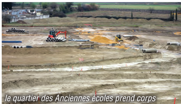
le quartier des Anciennes écoles prend corps