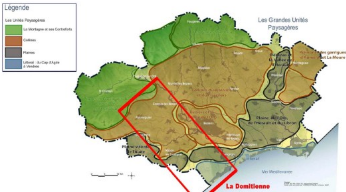
Figure 2 : Paysages du territoire de La Domitienne

Il possède également plusieurs espaces naturels d'intérêt patrimonial concernés par des périmètres d'inventaires, de gestion et/ou de protection naturalistes (zone naturelle d'intérêt faunistique et floristique, sites Natura 2000...) et constituant de fait des éléments de la trame verte et bleue 1 . Il possède enfin plusieurs sites d'intérêts patrimoniaux et paysagers (sites classés et inscrits, bien Unesco – voir figure 3).