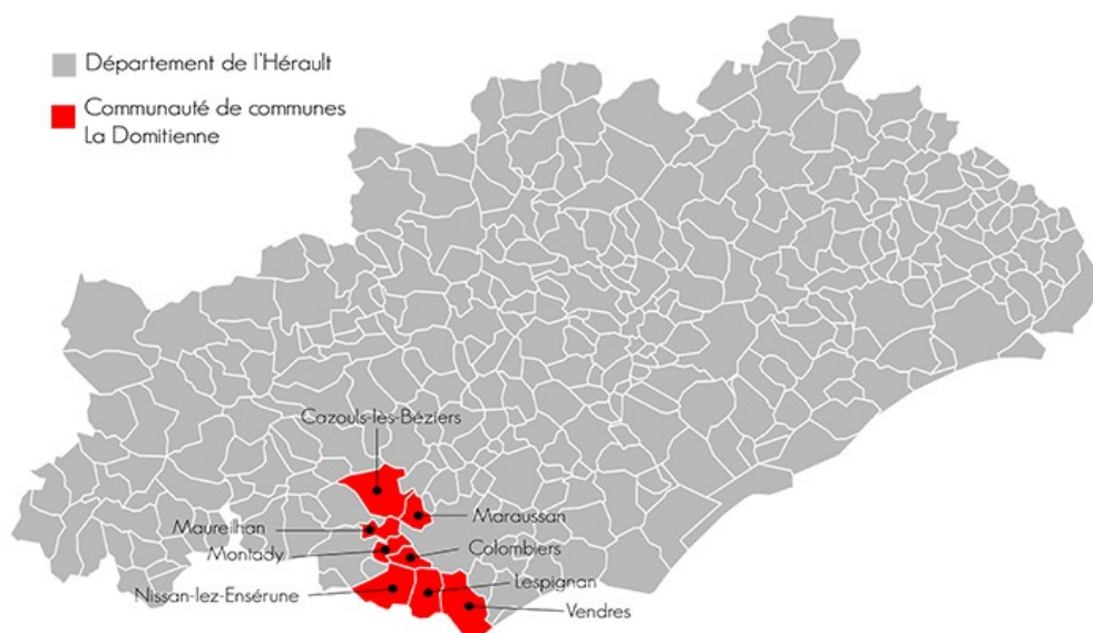
Figure 1 : localisation de la communauté de communes (site internet de la CC La Domitienne https://www.ladomitienne.com/ )

Le territoire du PCAET concerne la communauté de communes de La Domitienne qui est constituée de 8 communes (Cazouls-lès-Béziers, Colombiers, Lespignan, Maraussan, Maureilhan, Montady, Nissan-lez-Enserune et Vendres) et comptait environ 27 000 habitants en 2015 (INSEE).